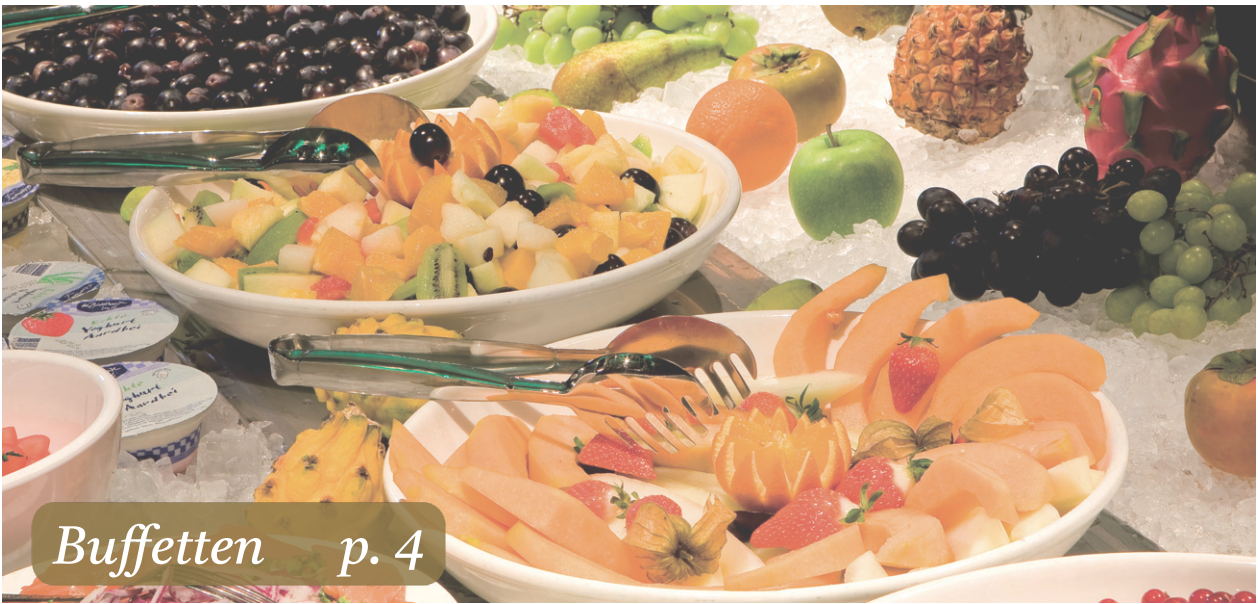
Buffetten p. 4