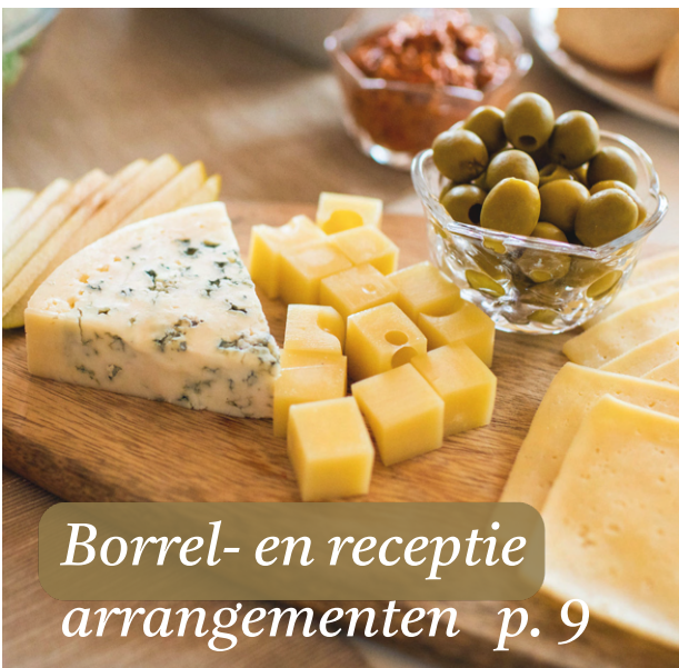
Borrel- en receptie arrangementen p. 9