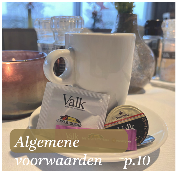
Algemene voorwaarden p.10