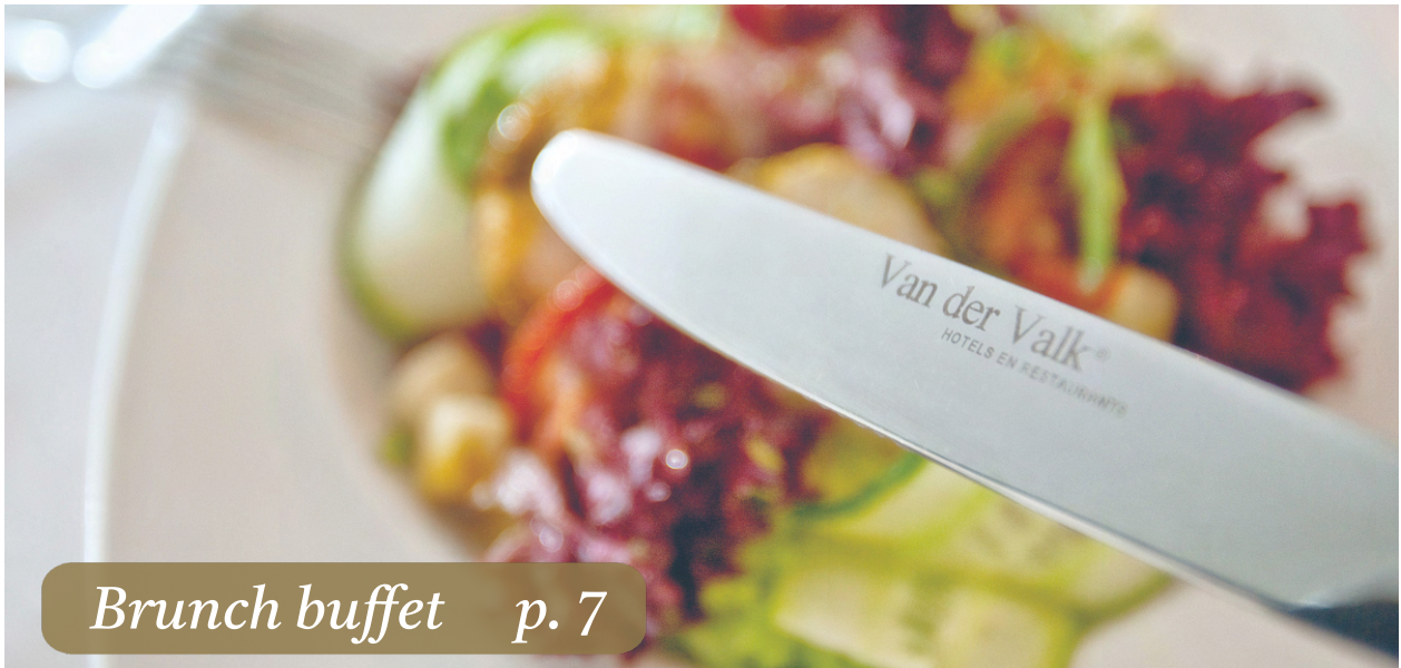
Brunch buffet p. 7